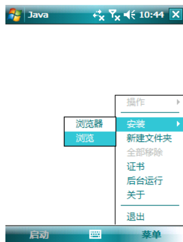
图 2 安装菜单

b) 稍后，出现可用的 java 程序列表，选择“SoftToken”项即可打开手机令牌程序。