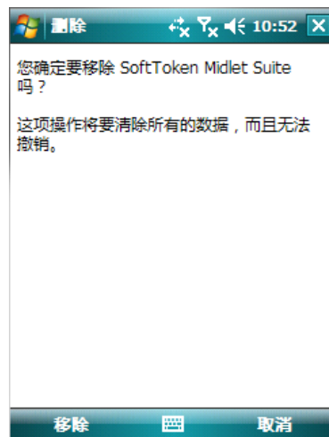
图 11 确认删除