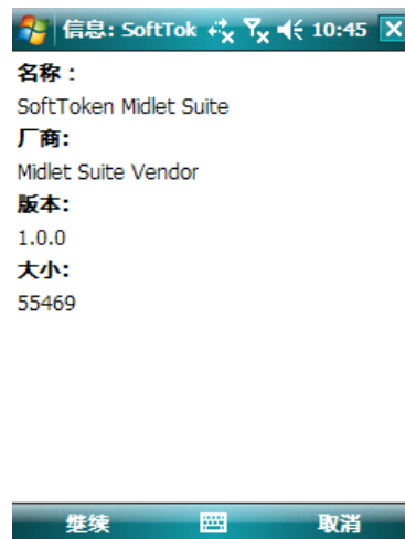
图 4 显示手机令牌程序相关信息