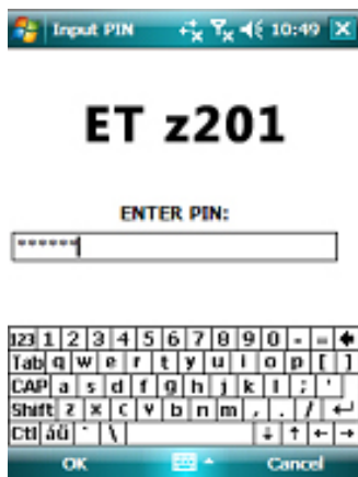
图 8 输入手机令牌 PIN