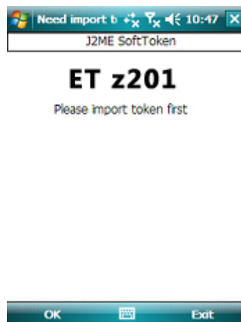
图 7 提示导入令牌种子