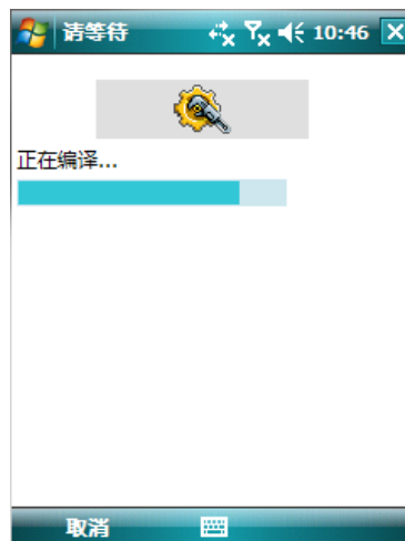
图 5 编译手机令牌程序