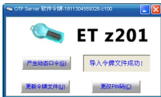
图 3 选择软件令牌种子