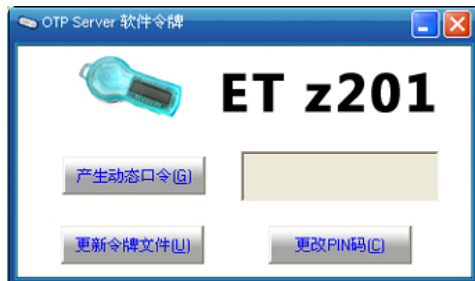
图 1 软件令牌

(2) 点击“更新令牌文件 (U)”，出现如下图所示界面，用户可以选择令牌种子文件。