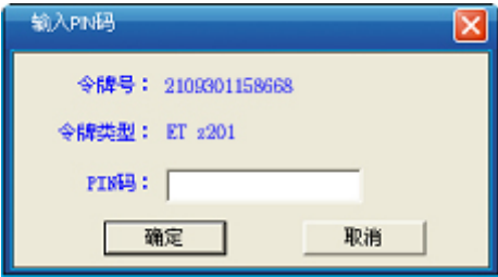
图 5 输入 PIN 界面

(6) 修改完成后点“确定”按钮，然后点击第(3)步中的“产生动态口令 (G)”按钮，出现如下图所示界面。