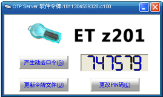
图 6 输入 PIN 界面

(7) 在提示窗口中输入 PIN 以后，单击“确定”按钮，软件令牌产生的动态口令就显示在界面上了，如下图所示。